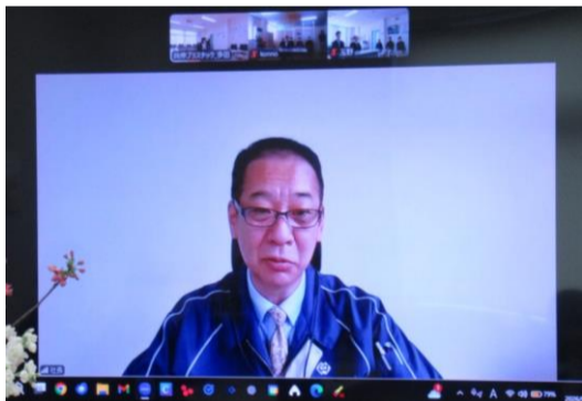
小野寺常務からの祝辞