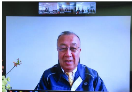
多田社長からの挨拶

初のリモート開催。本社飯能と福島・宮城を繋ぐ 本年度の入社式を実施し、本社飯能工場1名、福島工場1名、宮城工場2名、計4名が共伸プラスチックの新たな仲間として加わりました。今年度は当社初となるリモート形式で開催。本社飯能工場より開式の辞、社長挨拶、常務祝辞を配信し、福島工場・宮城工場では各会場にて拝聴しました。 その後は各工場ごとに辞令交付、先輩社員による歓迎の言葉、新入社員への自己紹介、閉式の辞、記念撮影を実施。それぞれの拠点で新たな門出を祝いました。